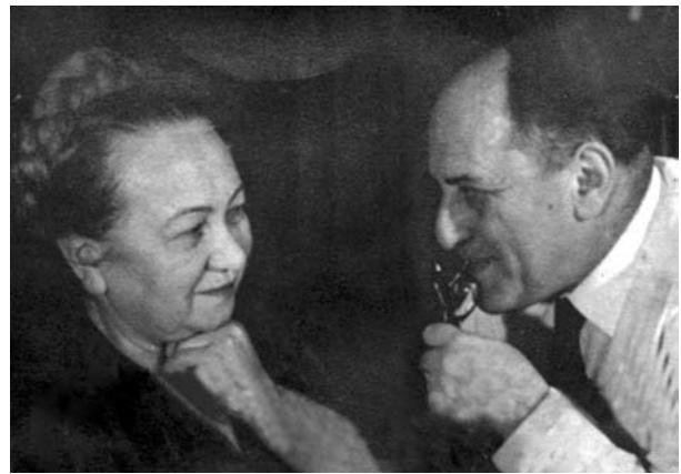
В мирі і злагоді до останньої хвилини життя

Одного разу він зателефонував мені і запропонував допомогти йому завершити цю роботу. Звісно, я не міг відмовити: