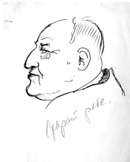
Дружній шарж, намальований О.І.Арутюновим

Недоліком, як пише Марк Карлович, була мала потужність нейрохірургічних відділень (в основному до 30 ліжок) і тільки у 7 областях України був організований цілодобовий прийом хворих із травмами нервової системи.