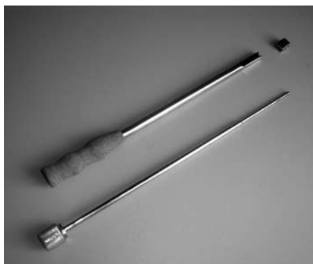
Рис. 3. Конструкция держателя кейджа и кейдж в разобранном виде.